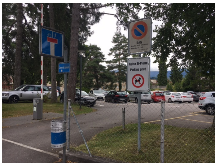
(Paroisse St-Pierre 07.03.2017 - 18h00) 1