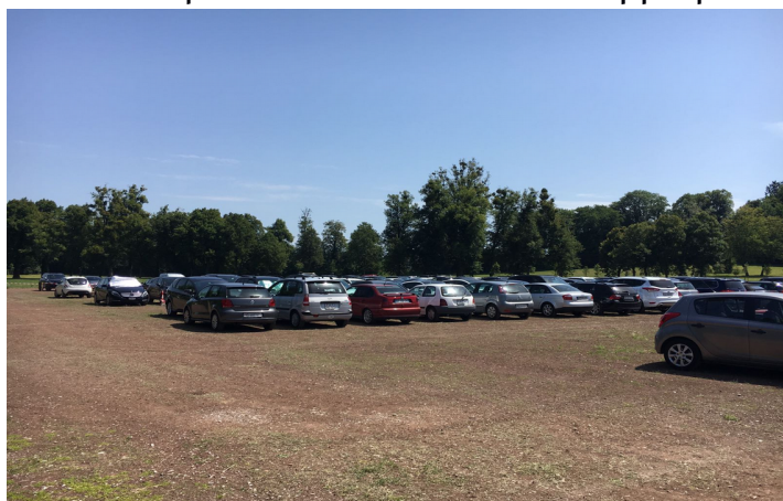
(Parc Poya – 8 juillet 2017)

L'ATE s'inquiète de l'utilisation inappropriée et de la création de nouveaux parking proches ou au centre même de la Ville de Fribourg. Ainsi par exemple nous avons demandé des explications au Canton concernant l'utilisation du parc urbain Poya à des fins de parking lors de certaines manifestations. Le Canton a répondu qu'un seul cas de ce type s'était produit en 2017 (justement celui que nous avons constaté).